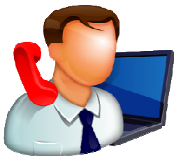
Менеджеры по закупкам

Для тех, кто постоянно занимается закупками у поставщиков по всей России.