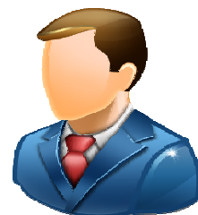
Техническим директорам Начальникам связи

Для тех, кому приходится рассчитывать проектные спецификации и искать по рынку недостающие позиции.